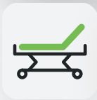
Rückenteil 0 – 70°