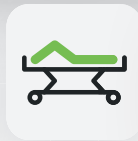
Fußteil 0 – 30°