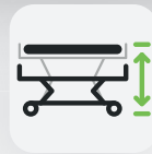
Höhe 385 – 810 mm

Das Pflegebett Ecofit S ist speziell für die häusliche Pflege entwickelt. Seine hohe Funktionalität und Langlebigkeit macht es zum idealen Produkt in diesem Preissegment.